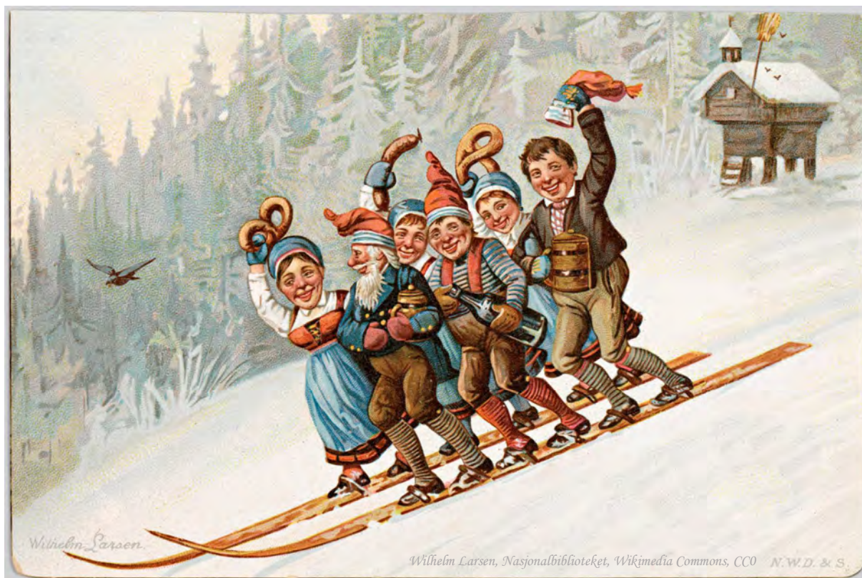
Wilhelm Larsen, Nasjonalbiblioteket, Wikimedia Commons, CC0 N.W.D. & S.