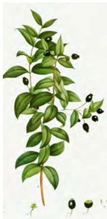
P-J Redouté, Rawpixel.com

Snerten = elegant / Kai rev av fjøsklærne i hurten og sturten kjekk / smart / lekker / fin = i hui og hast = i rasende fart