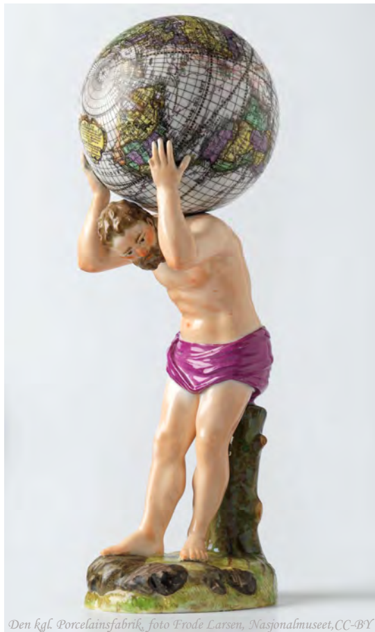
Den kgl. Porcelainsfabrik