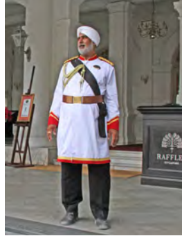
Tony Hisgett from Birmingham, UK - Doorman Raffles, CC BY 2.0 https://commons.wikimedia.org/w/index.php?curid=64147173