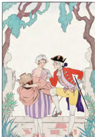
George Barbier, Rawpixel.com