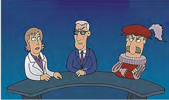
Skeptical Science *

svartnet snertne elegante bevertning oppvartning