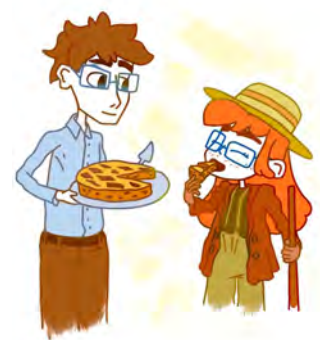
Oyvind Martinsen, Fokus ©