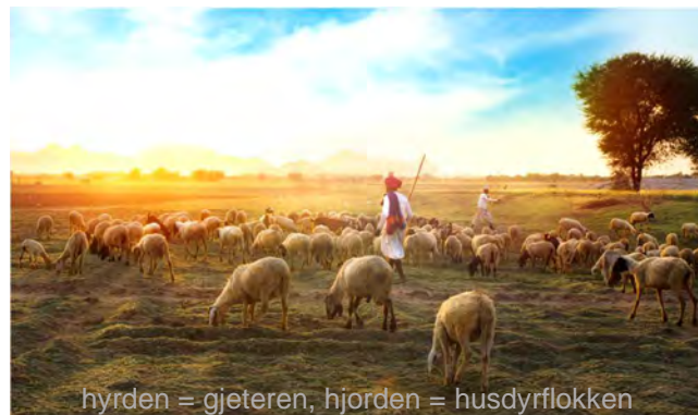
hyrden = gjeteren, hjorden = husdyrflokken