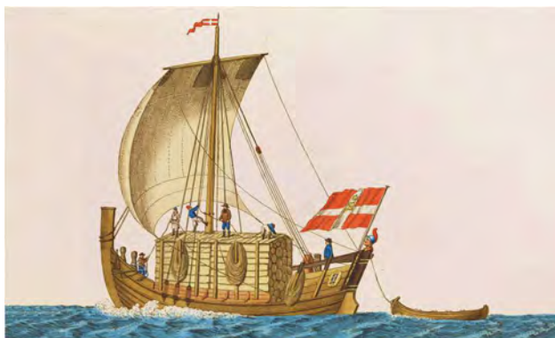
Johannes Senn