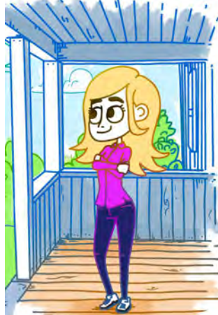
Oyvind Martinsen, Fokus ©