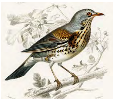
Charles Dessalines D'Orbigny