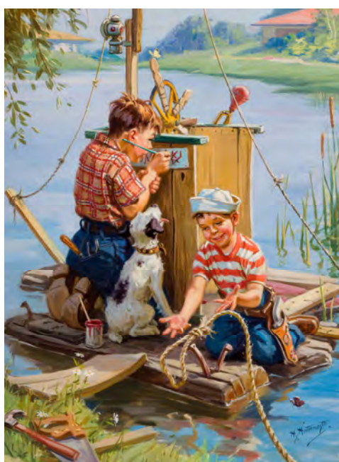
Henry Hintermeister, Heritage Auctions, Wikimedia Commons, public

Esten rimer: måten – gåten – såten – flåten – gråten – låten – båten – bråten