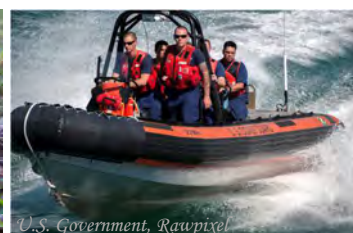
Besetning = mannskap Alle har på redningsvestene!