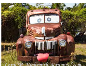
Se den rustne bilen!