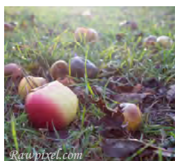
Her skjer forråtning!