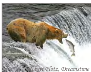
Se den spretne laksen!

forretning metning beretning unnsetning tetning fatning befestning besetning