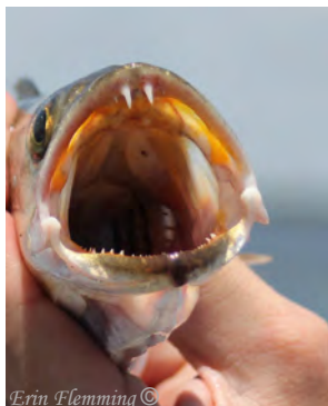
Erin Flemming ©