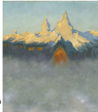
Theodor Kjøttelsen, Nasjonalmuseet, CC-BY, foto: Borre Høstland