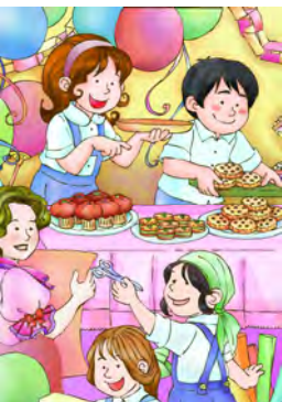
Fiestainfantil Phantanus, Wikimedia Commons, public

gifte seg gjestgiveri giverglede geitost gipsfigur gyngestol geiterams