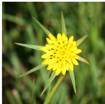
Goat's Beard flower