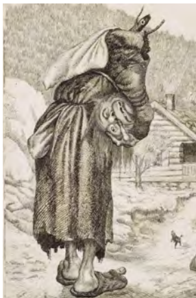
T Kjøttelsen, Nasjonalmuseet, CC-BY, foto: Morten Thorkildsen

tilgi tilgivelse begi seg påbegynt begynnelse forgiftet likegyldig forgylt